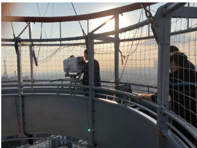
Expérimentation LIDAR Juillet 2018

Sur un plan collectif : réduire les émanations de précurseurs de l'ozone en particulier les oxydes d'azote en réduisant le trafic routier et les émissions industrielles.