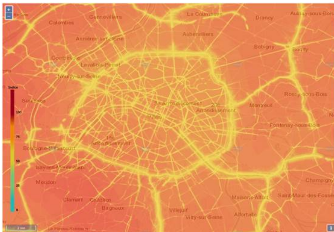
Carte Airparif de pollution à l’ozone, le 26 juillet à 16H, jour où les niveaux ont été les plus élevés

Toutes les infos pratiques sur le nouveau site www.ballondeparis.com