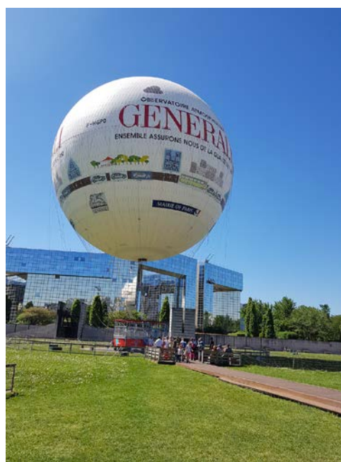
Le nouveau ballon Generali

https://www.generalif.fr/content/decouvrez-nos-guides-prevention/