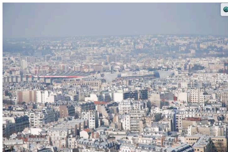
A 150 mètres, la pollution visible à l'œil nu